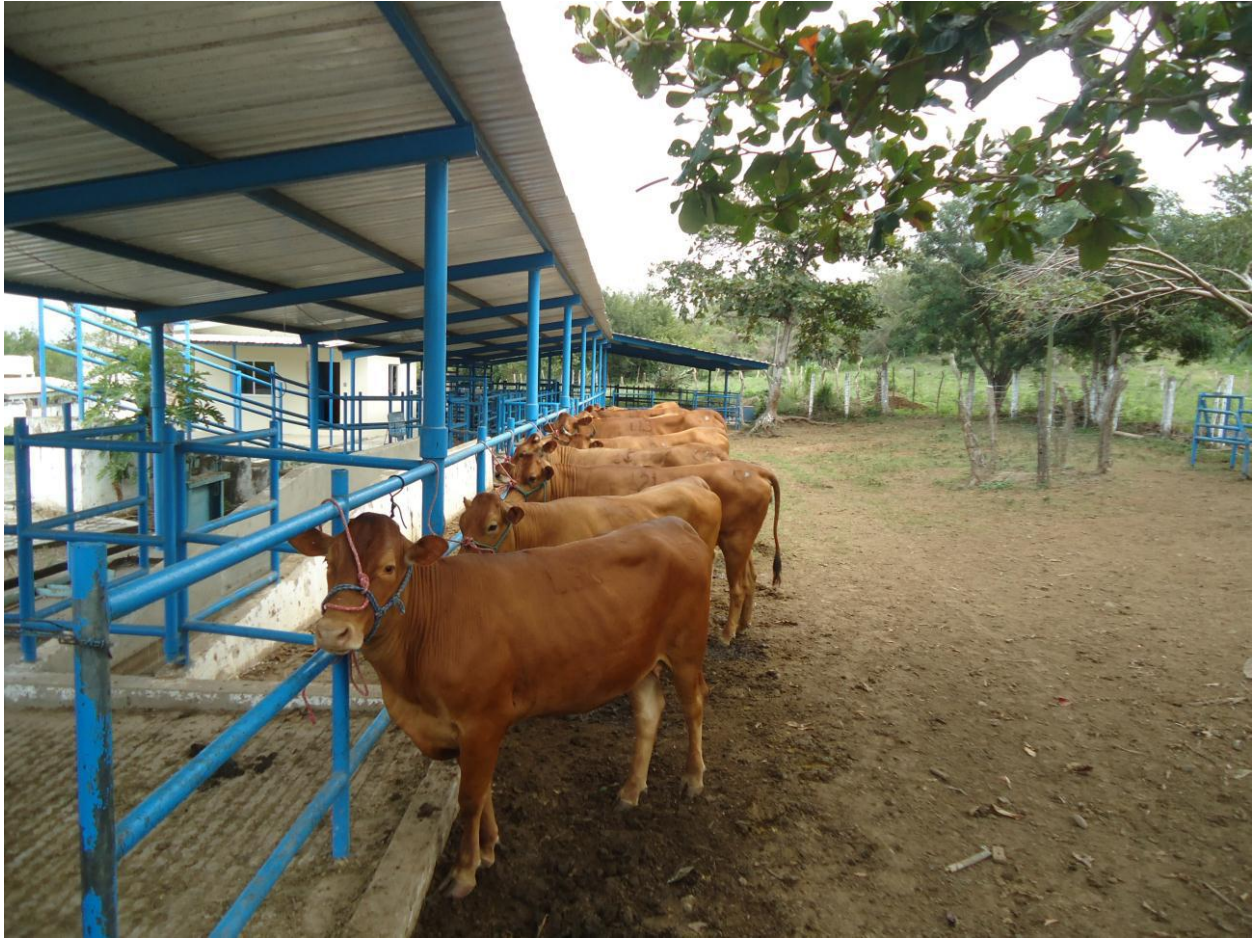
Anexo 5. Hembras Criollo Lechero Tropical utilizadas como donadoras de embriones.