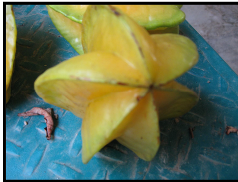
Figura 3. Aristas del carambolo

La baya en estado maduro es jugosa, presenta un aroma agradable, exhibe un color naranja opaco y contiene de una a cinco semillas. En el tamaño final de los frutos de carambolo se observa una alta variabilidad, resultado de la dispersión y número de frutos en el árbol, el vigor de la planta, las condiciones de desarrollo y el carácter silvestre de la variedad (Figura 3). Son frutos elipsoidales u ovoides con 5 costillas o prominencias longitudinales, en corte transversal aparecen como una estrella de 5 picos. Los frutos miden de 6 a 12 cm de largo por 3 a 6 cm de ancho. El pericarpio es amarillo duro y brillante; el mesocarpio es amarillo carnososo y acidulo.