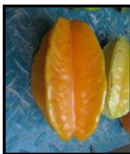
Figura 1. Forma del carambolo

El fruto es una baya carnosa de forma ovoide a elipsoidal variada (Figura 1), con cuatro a seis aristas longitudinales y redondeadas que lo dotan de una típica sección en forma de estrella (Figura 2), algunas veces modificada.