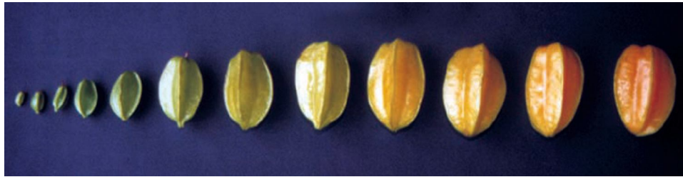
Figura 2. Fases del desarrollo del carambolo

La baya en estado maduro es jugosa, presenta un aroma agradable, exhibe un color naranja opaco y contiene de una a cinco semillas. En el tamaño final de los frutos de carambolo se observa una alta variabilidad, resultado de la dispersión y número de frutos en el árbol, el vigor de la planta, las condiciones de desarrollo y el carácter silvestre de la variedad (Figura 3). Son frutos elipsoidales u ovoides con 5 costillas o prominencias longitudinales, en corte transversal aparecen como una estrella de 5 picos. Los frutos miden de 6 a 12 cm de largo por 3 a 6 cm de ancho. El pericarpio es amarillo duro y brillante; el mesocarpio es amarillo carnososo y acidulo.